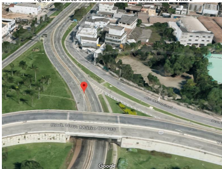
Figura 2 – Marco inicial do trecho objeto deste Edital – Vista 2

A seguir serão apresentadas as delimitações do comprimento do trecho piloto. A Figura 3 e a Figura 4 apresentam o marco final.