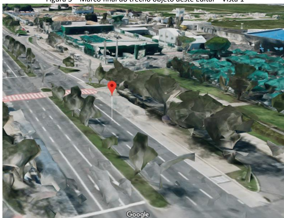
Figura 3 – Marco final do trecho objeto deste Edital – Vista 1

A seguir serão apresentadas as delimitações do comprimento do trecho piloto. A Figura 3 e a Figura 4 apresentam o marco final.